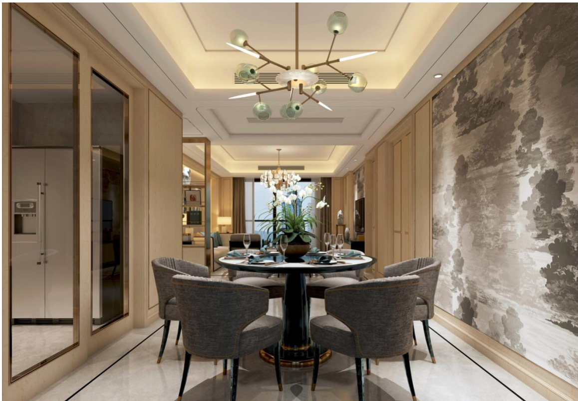
荣安姚江晴雪园精装修样板房效果图。

居住环境，实现家庭生活更加安全，节能，智能，便利和舒适。智能家居可以实现远程控制，安防、安保等全方位的控制管理，因而被很多人推崇。公司未来会在精装修的基础上不断增加智能家居系统，智能用电、智能安防、照明智能、窗户、窗帘、温控等所有的家电以及家居设备，未来将有可能通过手机一键控制。