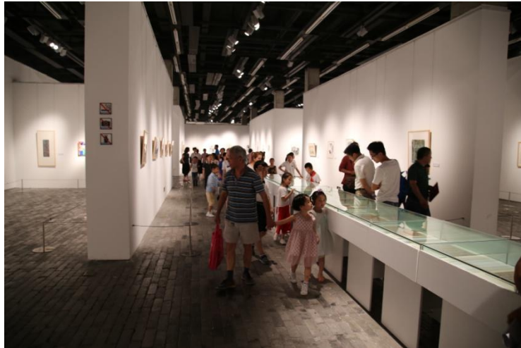
2017 年荣安杯少儿艺术展

荣安地产多年来致力于成为一个负责任的、感恩的优秀企业公民，努力通过企业公民活动以及慈善公益活动来助力社会的发展。荣安提出“公益行为基因化”、“公益行为大众化”、“公益行为常态化”的公益理念，秉承这一理念，荣安自成立以来，在公益慈善方面累计捐资 2000 多万元，公益事业投入达到了 1.2 亿多元。2017 年，公司出资 20 万元设立专项公益金，专款用于大提琴家马友友的故乡——宁波市鄞州区咸祥镇中小学校的特色教育定向扶助，培养大提琴的好苗子；同时，公司继续捐资 10 万元，定向帮助宁波象山县农村地区改善老年活动设施。