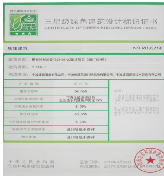
香园北项目的三星级绿色建筑标识证书。

这些项目提高与创新部分主要采用了建筑信息模型（BIM）技术、供暖空调系统的冷、热源机组能效均优于现行国家标准《公共建筑节能设计标准》GB 50189 的规定以及现行有关国家标准能效节能评价的要求、采用高性能围护结构保温材料，大大降低了供暖空调全年计算负荷，供暖空调全年计算负荷降低 15%以上等措施。同时配合其他的如节水灌溉、雨水回用、节能灯具、节水器具等技术，确保本建筑的节能、高效、低耗、环保，比起基准建筑节能率达到 65%以上。