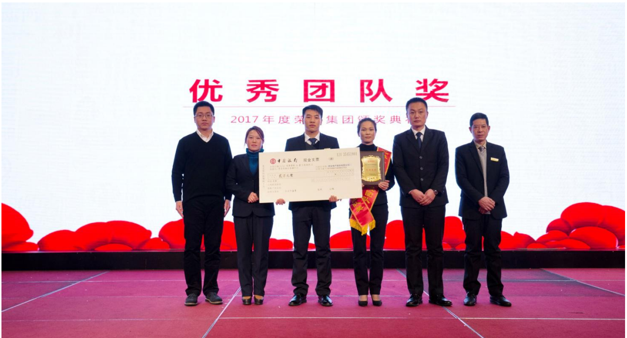
图为 2017 年度颁奖典礼现场。